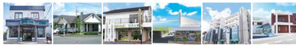
【(株)井上地所/岩出店】 【(株)井上地所/五條本店】 【(株)井上地所/吉野案内所】 【(株)井上地所/奈良中央店】 【(株)井上地所/橋本店】 【(株)井上地所/五條店】