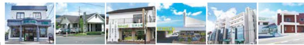
【(株)井上地所/岩出店】 【(株)井上地所/五條本店】 【(株)井上地所/吉野案内所】 【(株)井上地所/奈良中央店】 【(株)井上地所/橋本店】 【(株)井上地所/五條店】

Facebook X(旧Twitter) Instagram YouTube やってます! (株)井上地所 ウェブ検索